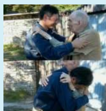
李安与伯格曼的拥抱 2006年

伯格曼在上世纪50年代年的电影作品中,大量使用了巴赫、贝多芬、莫扎特、门德尔松、舒曼、李斯特、肖邦的古典音乐,作为点缀或渲染情绪的配乐。进